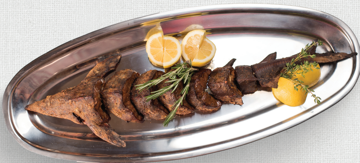
Стерлядь горячего копчения HOT SMOKED STURGEON